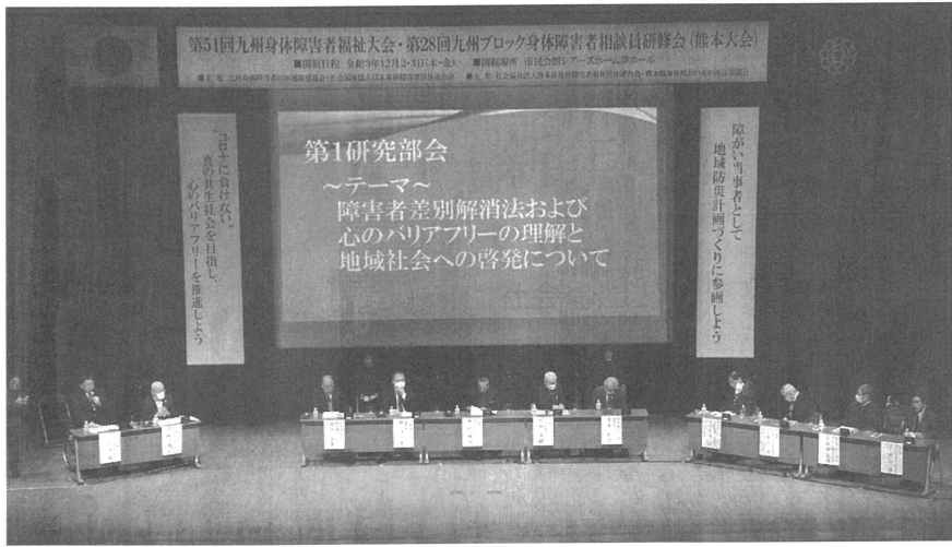
九州ブロック身体障害者相談員研修会 第1研究部会の模様