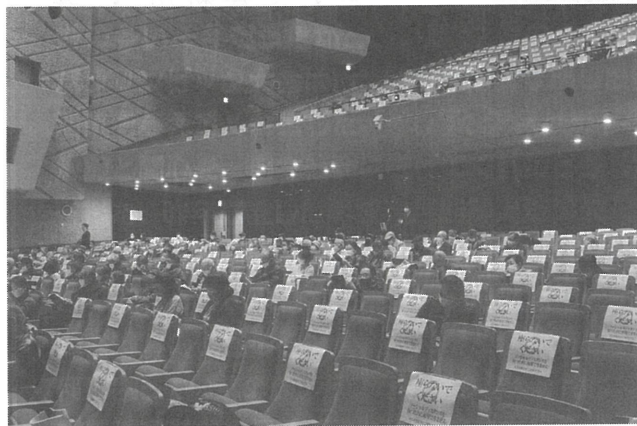
客席は十分な間隔を取って開催された(九州ブロック)

新型コロナウイルス感染症の感染状況は、オミクロン株などの影響により依然不透明な状況が続いています。そのような中、近畿・九州ブロックの身体障害者相談員研修会がオンライン等を活用しながら1年ぶりに開催されました。