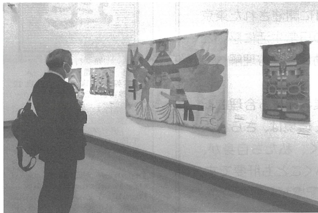
高円宮記念ギャラリーの展示

を継ぐ発達障害を持つカナダ人アーティストたちの作品約20点が、大使館内にある高円宮記念ギャラリーに展示されています。障害者の作品に対する一般の見方に影響を与え、挑み続けている作品がご覧いただけます。