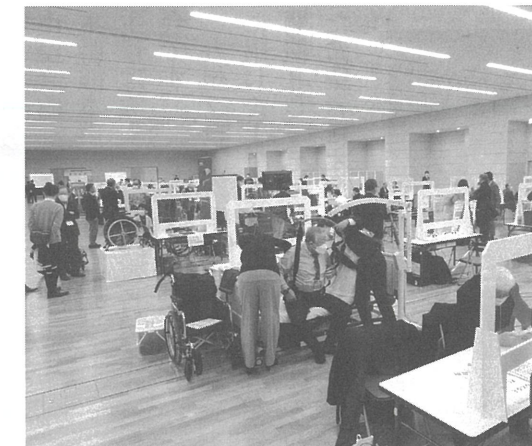
シーズ・ニーズマッチング交流会2021の様相

この交流会は、障害者自立支援機器の開発を促進することを目的に、障害当事者をはじめ、ご家族、福祉・医療従事者などの「機器を使う側(ニーズ)」の方々と、開発企業、大学、研究機関、産学官交流振興組織などの「機器を作る側(シーズ)」の方々が、直接交流することができるところを提供することを目的としています。東京会場(12月7日～8日)は東京都立産業貿易センター浜松町館で開催され、貴重で多彩な意見交換の場となりました。