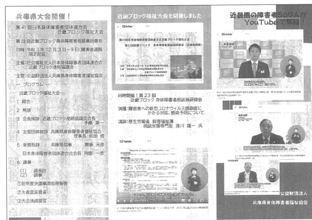
近畿ブロック福祉大会・身体障害者相談員研修会の開催概要リーフレット

近畿ブロックでは、会場開催は行わずに、事前に録画編集した講演等の映像を、障害者週間に合わせて12月3日から9日の間、YouTubeで限定配信するという形式がとられま