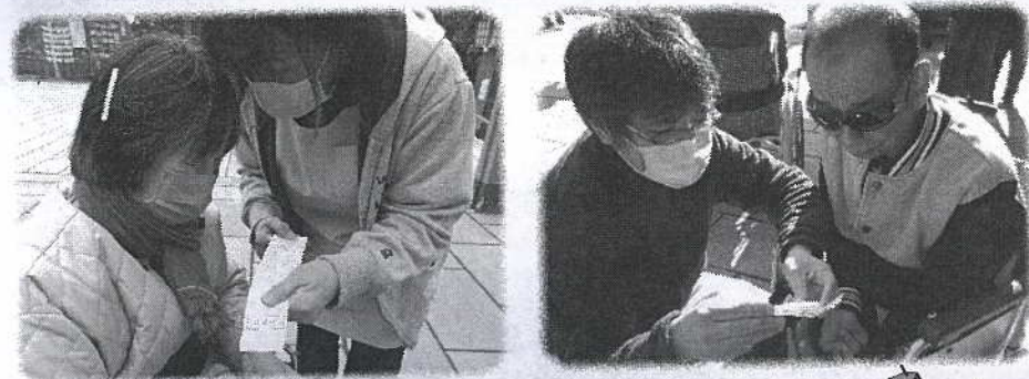
おみくじで今年の運を占います。結果はいかが!?