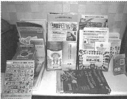
ちょっとした時間に是非ご覧ください(^.^)

ゆうかり学園には他事業所や地域からの情報を冊子等でいただくこともあります。いろいろな方にもご覧いただけるようになるとなると皆様の目に入る場所(外来待合室の一角)に置いており、なかには学習会や研修の開催情報などもあり知りたかったことを期待きっかけになることを期待しています。