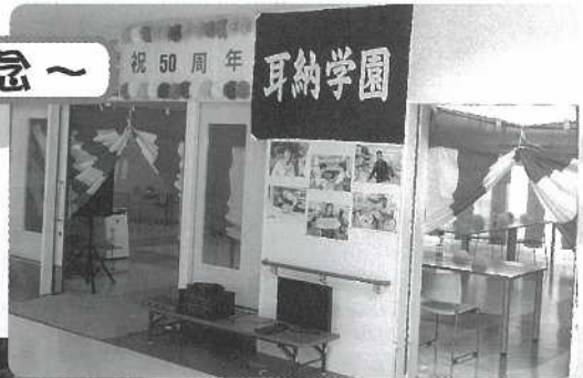
△ 耳納学園開園記念☆祝50周年☆