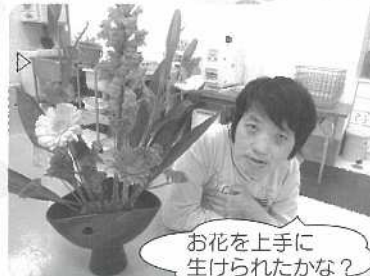
お花を上手に 生けられたかな?