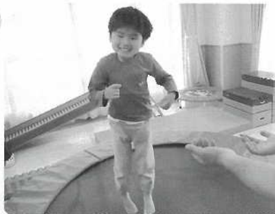
△ トランポリンたのし～い月