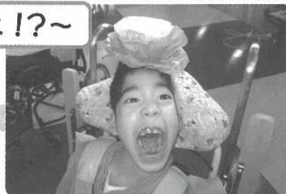
△ 花祭り行事に参加したよ