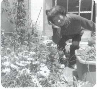
大好きな春の花に 囲まれて♪