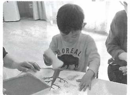
△ どこにしようかな?

生になりました!! ② 一日でも早く高校生活に慣れて、学校生活を楽しみたいです。 ③ 学校へ行き、たくさん友達を作って一緒に遊びたいと思います。