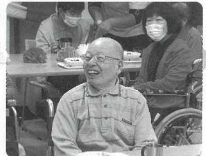
△ 昔のビデオ視聴中～懐かしい～