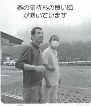
春の気持ちの良い風 が吹いています