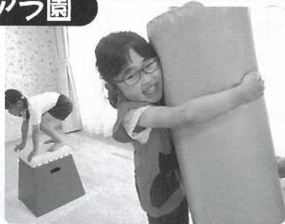
△ コアラになっちゃった(^ ^)☆☆