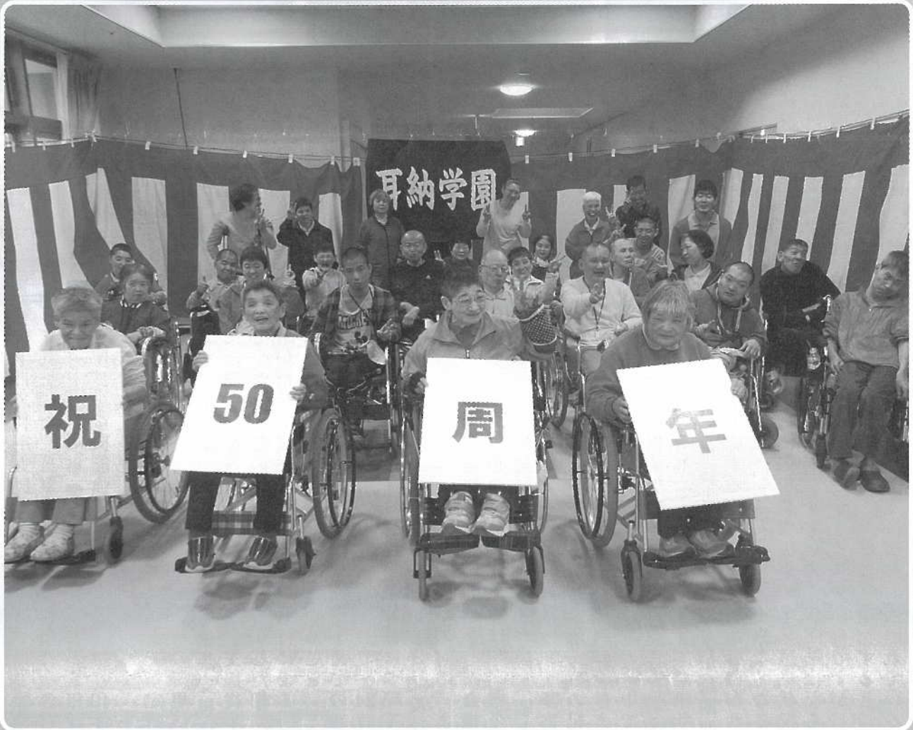
耳納学園☆祝 50 周年☆元気にピース