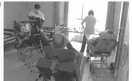
窓の外には3階からの眺め。この日は天気も良く、少し遠くに鯉のぼりが泳いでいるのを見えました(^.^)