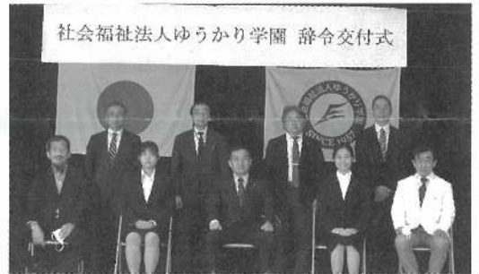
入職された方たちと記念撮影。新しい仲間としてよろしくお願ひ致します。