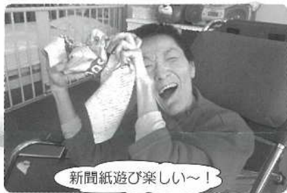
新聞紙遊び楽しい～!