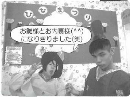
お雛様とお内裏様(^^) になりきました(笑)