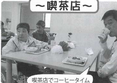
喫茶店でコーヒータイム