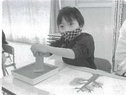
△ いっぱいつけるぞ～!