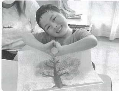
△ きれいな桜ができたよ♡