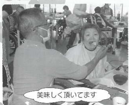
美味しく頂いてます