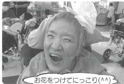
お花をつけてにっこり(^^)