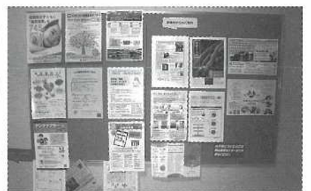
地域支援棟の1階掲示板にも様々な情報を掲示しています。近くにはパンフレット等も置いています。