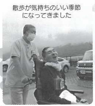
散歩が気持ちのいい季節 になってきました