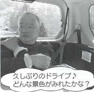
久しぶりのドライブ♪ どんな景色がみれたかな?