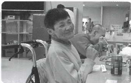
△ お弁当にノンアルコール美味しい☆