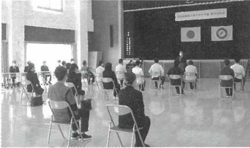
感染対策のため広い場所での辞令交付式となりましたが、その中でも緊張感は伝わってきました。

4月1日、辞令交付式と新人職員研修がありました。辞令交付式は地域支援棟交流ホールで行われ、次に新人の方については1回目の研修がありました。自己紹介をした後、午前中は理事長による講義、午後からは利用者様の気持ちに寄り添った支援が提供できるように車椅子操作や食事介助の実技研修があり、最後は各施設担当者からの施設紹介がありました。これから一緒に働いていく中でわからないことも多々あるかと思いますが、その時は周りの先輩方を頼りながら、一緒に頑張っていきたいと思います。