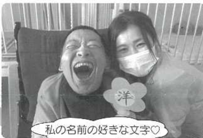
私の名前の好きな文字♡