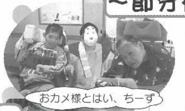
おかメ様とはい、ちーず