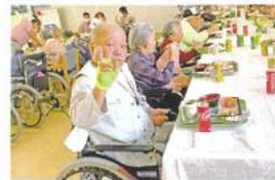
久しぶりの行に笑顔でピース