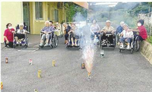
やっぱり花火はいいね〜♪

八月十九日、つつじ苑にてミニ納涼祭を開催しました。コロナ禍で地域やご家族との交流が制限される中、ゴーヤー、ナーベラーチームに分かれ魚釣りゲーム、射的ゲームと皆さん夢中になりました。夕食後は本日、最大のイベント花火大会を実施。打ち上げ花火、手持ち花火と大いに盛り上がり楽しいひと時を過ごしました。