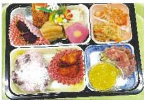
栄養士、厨房職員の力作！