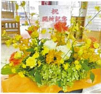
盛花で開所記念をお祝い♪