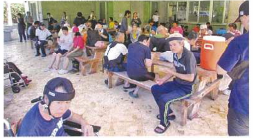
くつろぎのひと時