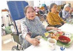
ごちそういっぱい