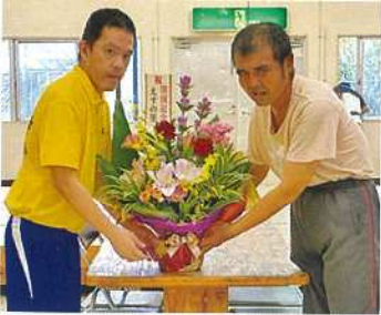
えすの里開所当初が生活している利用者と記念写真