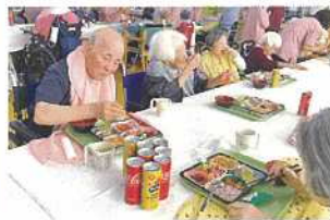
食事の手もすすみます