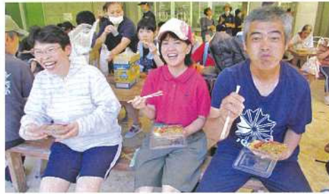
いただきま〜す(ハ▽ハ)