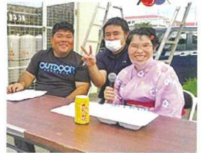
会社バッチリ任せて!