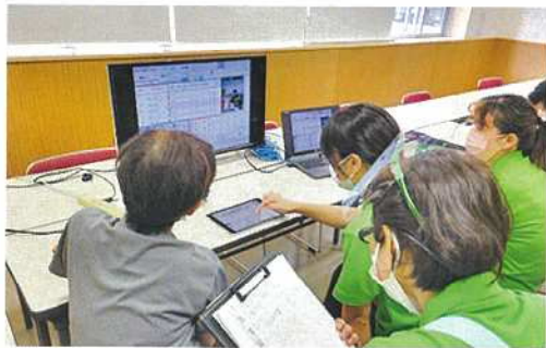
業者とのオンライン勉強会の様子

一心療護園では、業務効率化を図るべく現在使用している福祉記録ソフトに連動するタブレット端末の活用に着手しています。バイタルチェックの機器との連動、マイクを活用した記録、排泄、入浴、食事状況の記録も含め上手く活用すれば効率アップ間違いなし！現在、勉強会を行いながら実験中です！