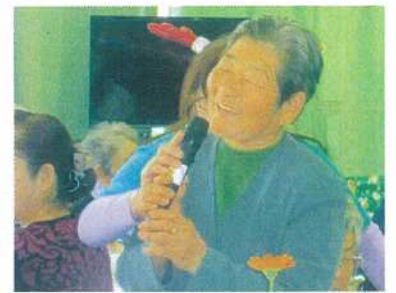
忘年会で歌を披露

た格好で行くようにしていました。 五〇歳くらいの時に自動車の免許をとりました。一回で合格したので、家族からはびっくりされました。 私が六十三歳の時に、夫が病気で入院することになり、半年病院で入院した後、自宅で七年