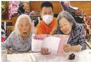
皆で歌って楽しいよ〜♪