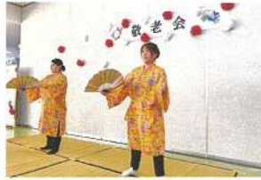
職員による幕開け