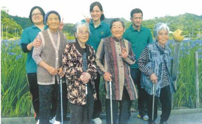
「小規模 あがり」での外出（オクラレルカ見物）前列中央

くらい、畑仕事（パイプ）をしながら介護をしました。仕事の合間に、洋裁をしたりして、孫の服や自分の部屋着を作ることが楽しみでした。孫は、今では、十二名います。 七〇歳頃から、デイサービスへ通うようになり、地域の皆さんと会って、レクレーションをしたり、外出したり、楽しく過ごしました。今は、沢山の皆さんと賑やかに過ごしています。 本人、家族に聞き書き