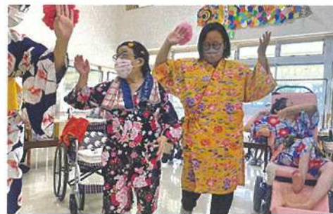
車椅子から立ち上がる程楽しかったね♪