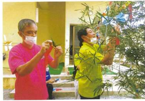
願いが叶いますように