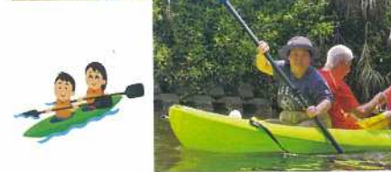
カヤック漕ぎ、きまっています!