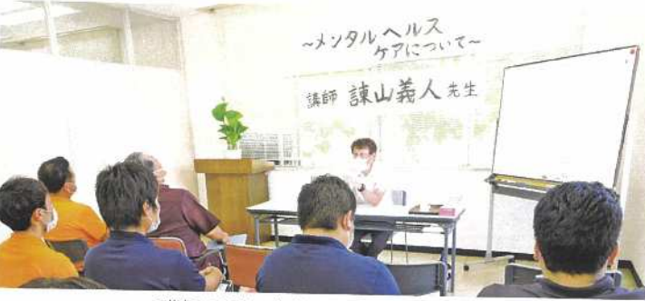
講師の話に真剣に耳を傾ける職員