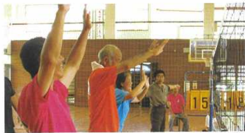
準備OK、いつでもこーい!