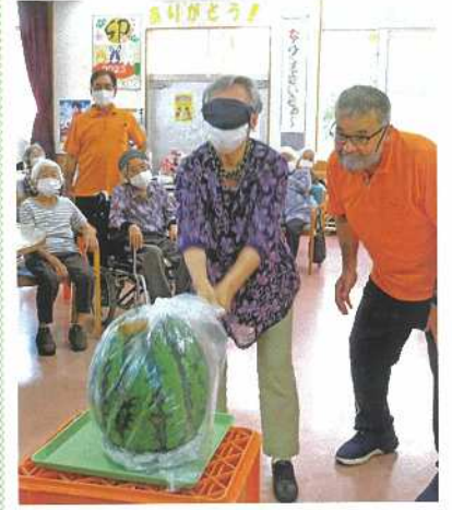
綺麗に一発で割れました。

んな中、女性の最後の方が見事に的中させ拍手喝采で盛り上がりました。甘くて美味しいスイカをいただき、利用者の皆様の満足した笑顔を見ることができました。