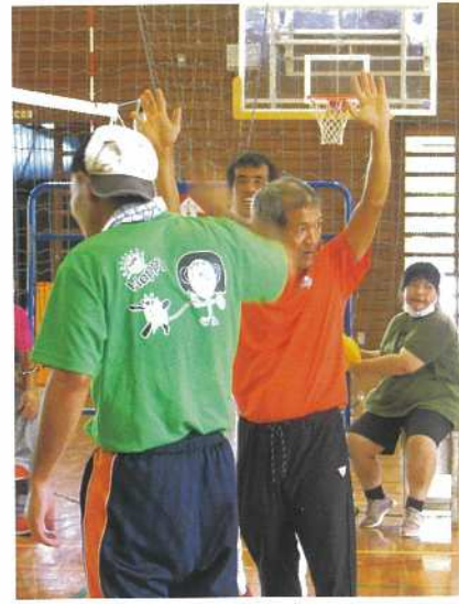
しまっていこーうぜ!