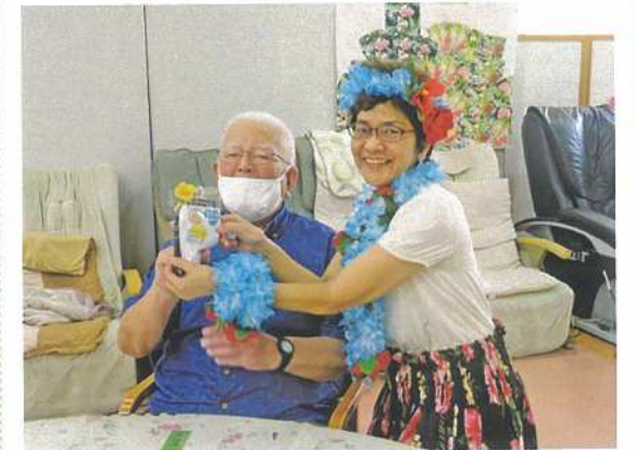
プレゼントをもらって笑顔が溢れています。