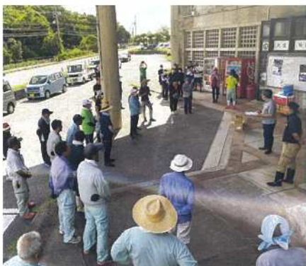
大宜味村商工会会長より趣旨説明