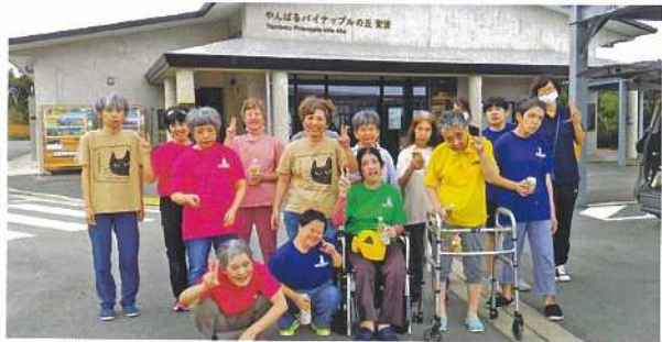
やんばるパイナップルの丘を背にハイポーズ👏