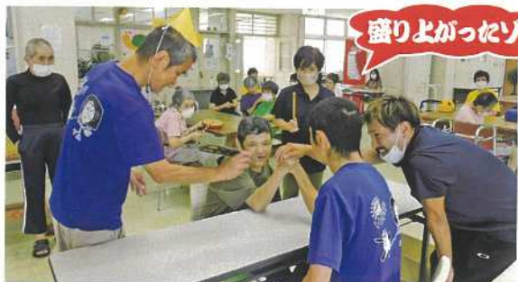
ハッケヨイ ノコッタ!!