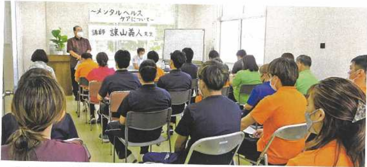
理事長挨拶、メンタルケアの大切さについてお話がありました。