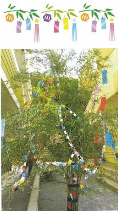
♪ささの葉 さらさら♪