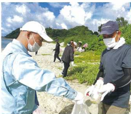
海岸がきれいになると気持ち良いネ