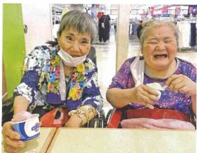
アイスクリームおいしい😊

数年振りに個別での外出支援を実施、利用者さん二名、職員二名で名護市イオンモールへ出かけました。久しぶりの外出に大喜びの利用者さん、好きな洋服を選んだり、食べた物を選んだり、有意義な時間を過ごされました。