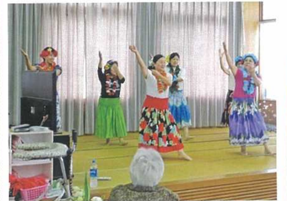
女子職員によるフラダンスを披露♪