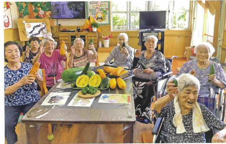
たくさん「とったど〜」!