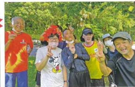
ハイビスカスの花かんむり、ステキです。