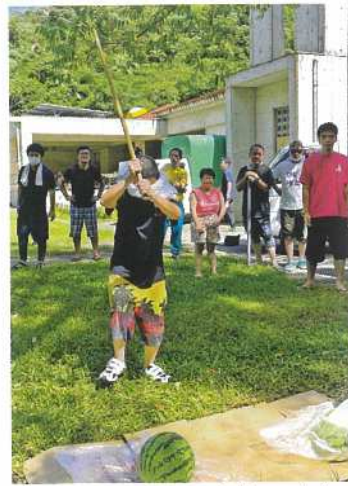
エイ・ヤーうまく割れるかな