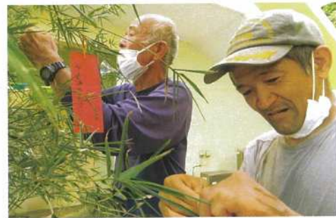
うまく飾れるかな？

七夕前日、作業から帰ってきた利用者さんへ休日作ってもらった飾りや短冊を手渡し笹の葉に飾ってもらいました。ハシゴに上り高い所を目指し利用者さんの姿も見られ、笑顔で楽しい雰囲気にも包まれた一時。短冊に