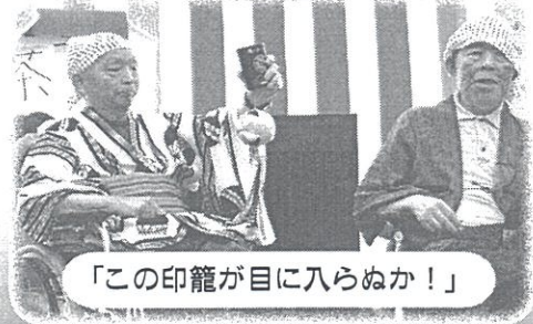
「この印籠が目に入らぬか！」