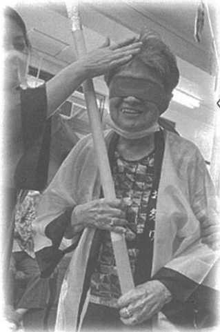
よし、すいか割るぞー🍉