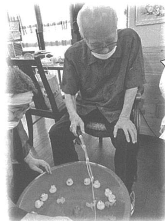
職員と一緒に沢山釣るぞー🐟