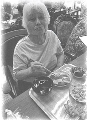
寿司まーさんどー☺